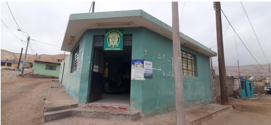
Foto 10. Afiche pegado en la Comisaría Rural PNP Ocoña.