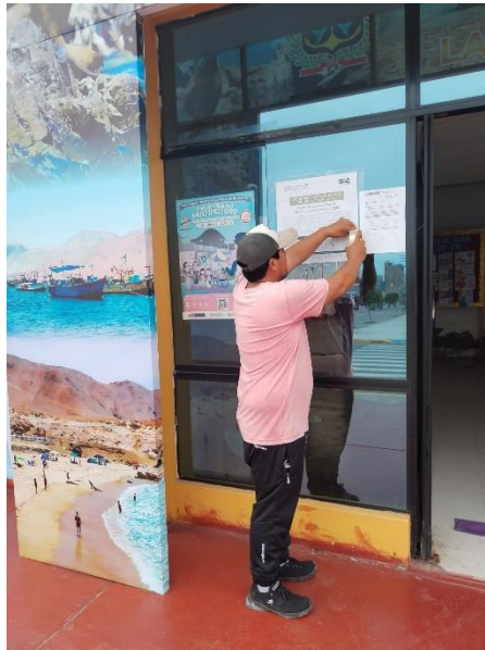
Foto 6. Pegado de afiche en el ingreso principal de la Municipalidad Distrital de Atico.