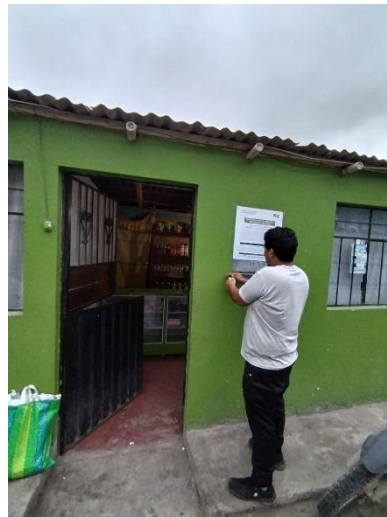
Foto 14. Afiche en tienda de la localidad Sector Punta Negra – Mollebamba.