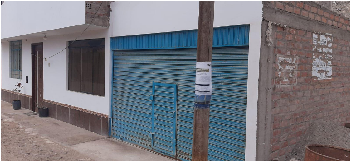
Foto 15. Afiche pegado en el A.H. Santa Rosa.