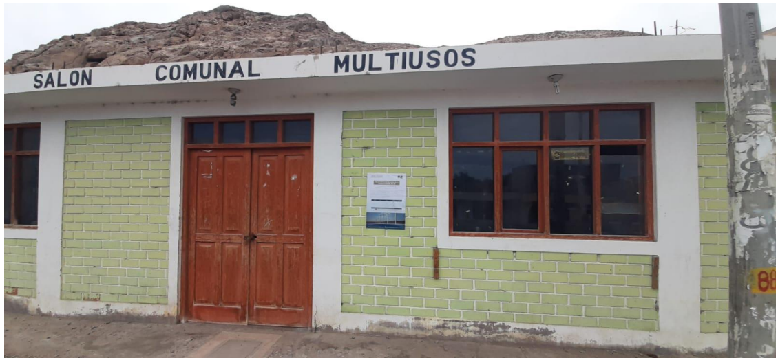
Foto 11. Afiche informativo del Taller pegado en el Local Comunal del CP Pescadores.