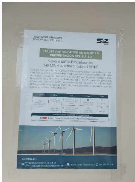
Foto 4. Afiche pegado en el frontis de la Municipalidad Distrital de Ocoña.