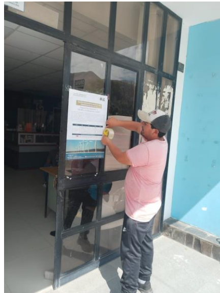
Foto 1. Pegado de afiche de convocatoria al Taller en la Municipalidad Provincial de Caravelí