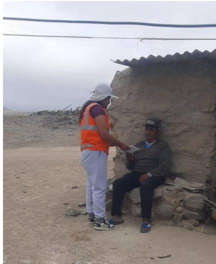
Foto 16. Entrega de material informativo en el A.H. Santa Rosa.