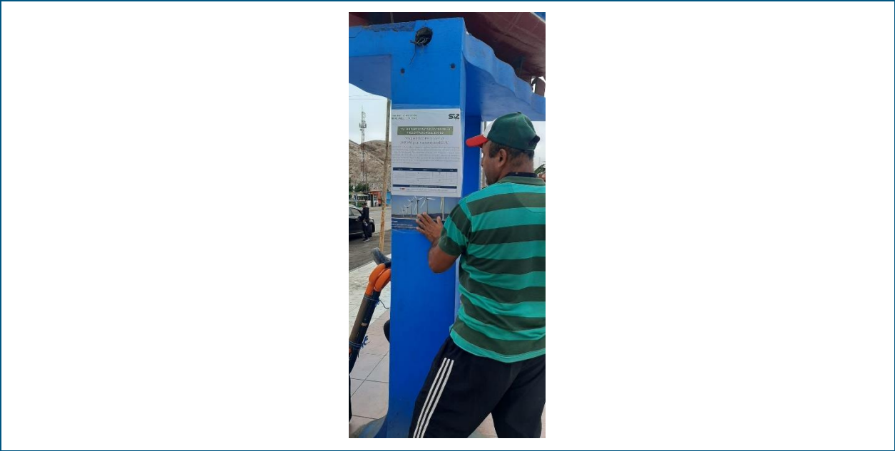
Foto 8. Pegado de afiches en lugares de concurrencia pública en el CP La Planchada.