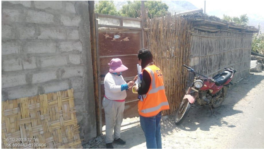
Foto 13. Entrega de volante informativo del Taller en la localidad Sector Punta Negra – Mollebamba.