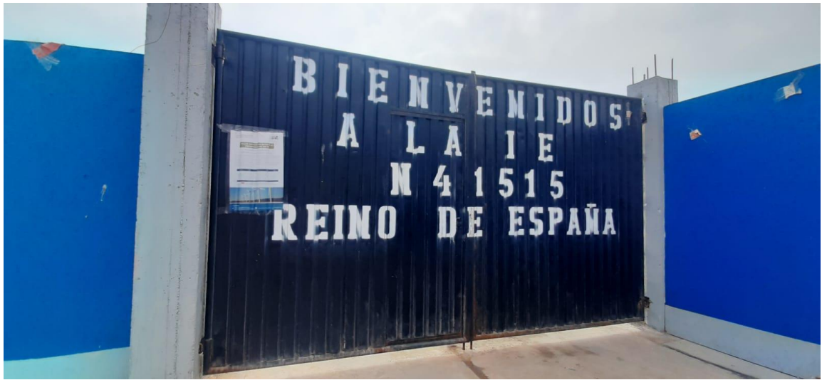
Foto 9. Afiche pegado en el frontis de la I.E. N°41515 Reino de España, CP La Planchada.