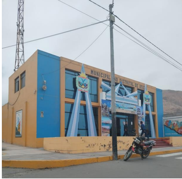
Foto 5. Municipalidad Distrital de Atico.