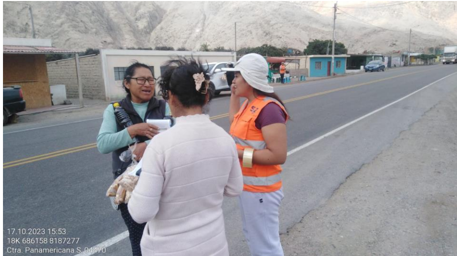
Foto 18. Entrega de material informativo del Taller en el CP Pescadores.