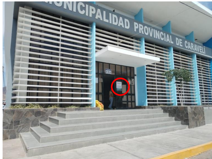
Foto 2. Municipalidad Provincial de Caravelí. Afiche pegado en el frontis de local Municipal.