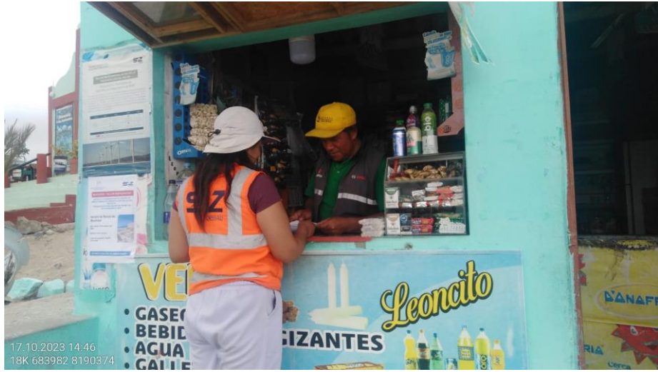
Foto 17. Entrega de volante informativo del Taller en la localidad Anexo Calaveritas.